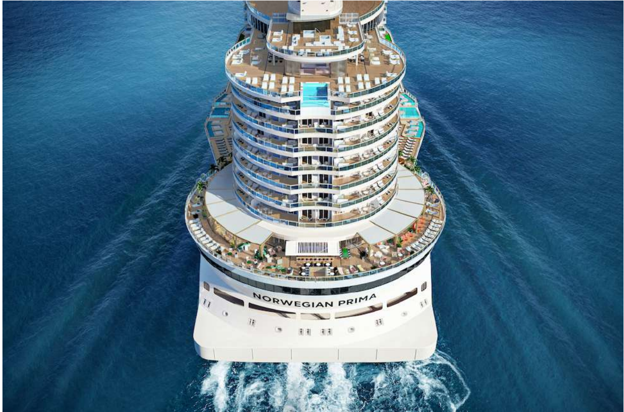
Poupe Norwegian Prima