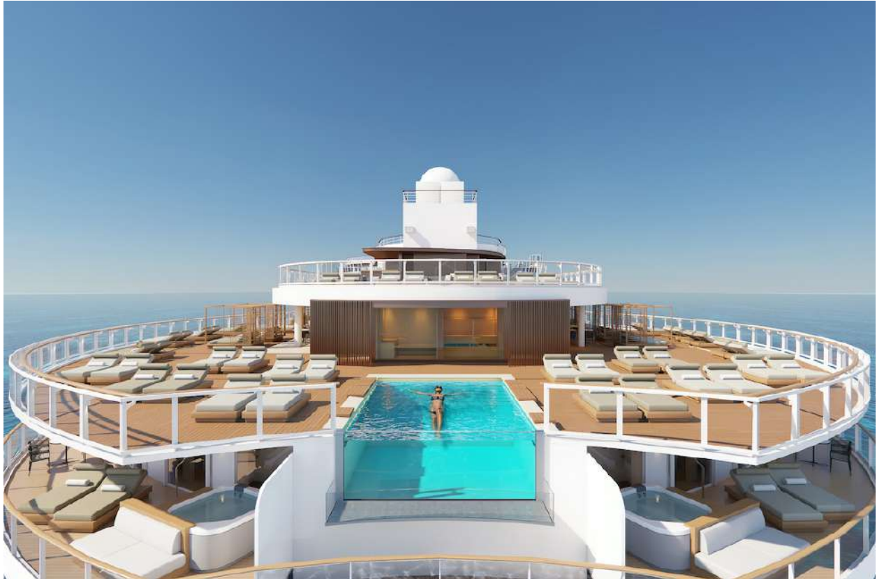
The Haven by Norwegian