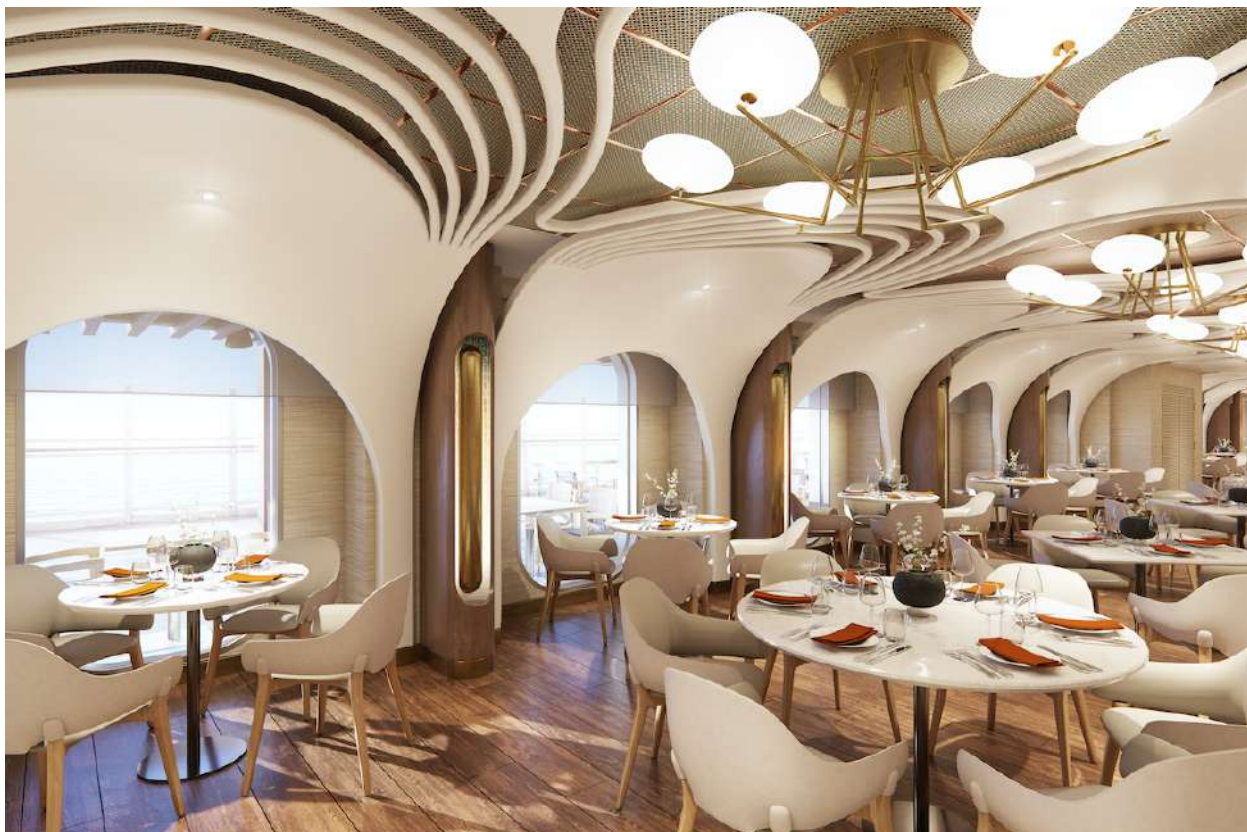
Onda by Scarpetta

emporium servant des plats de nouilles du monde entier, de la cuisine italienne à la cuisine thaïlandaise ; Tamara , préparant des plats indiens classiques avec de multiples options végétariennes ; The Latin Quarter , et ses plats Latins classiques avec une touche d'originalité ; Tapas Food Truck , cuisinant des recettes d'inspiration espagnole ; Garden Kitchen , où les clients peuvent commander des salades personnalisées avec plus de 20 ingrédients au choix ; Just Desserts , et ses desserts classiques tels que des tartes et des gâteaux ainsi que Just Ice Cream , pour les fans de desserts glacés .